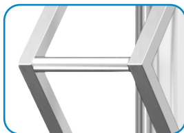
Stelaż ze stali nierdzewnej