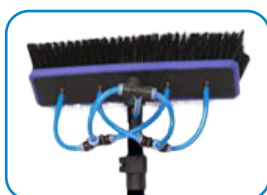
Lanca teleskopowa ze szczotką