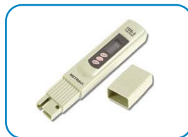
Ręczny miernik jakości wody