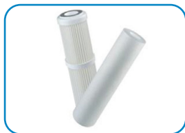
2 wkłady: wstępny i DI