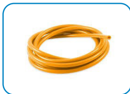
Wąż podłączeniowy – 30 m